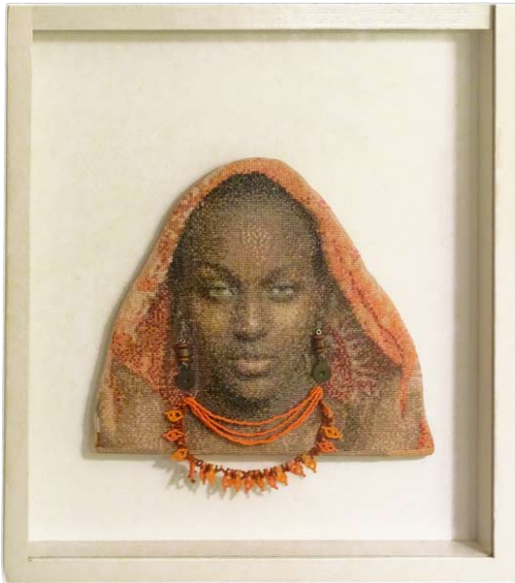
BLACK MADONNA IV, haft krzyżykowy na płótnie, koraliki, drewno, płyta, szyba, 43,5x39,5 cm, 2014.