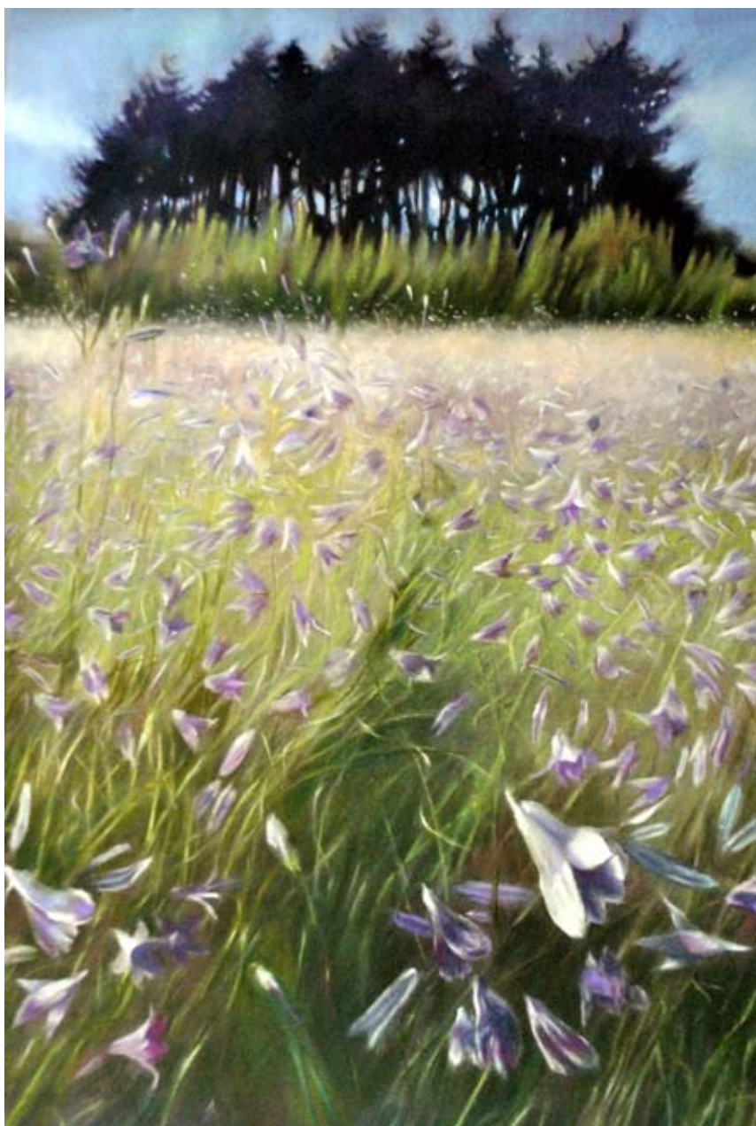
DZWONKI NA MAJDANIE, pastel suchy 100x70 cm, 2014.