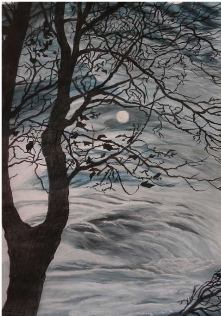
BEZ TYTUŁU, węgiel i tempera, 70x50cm, 2014.