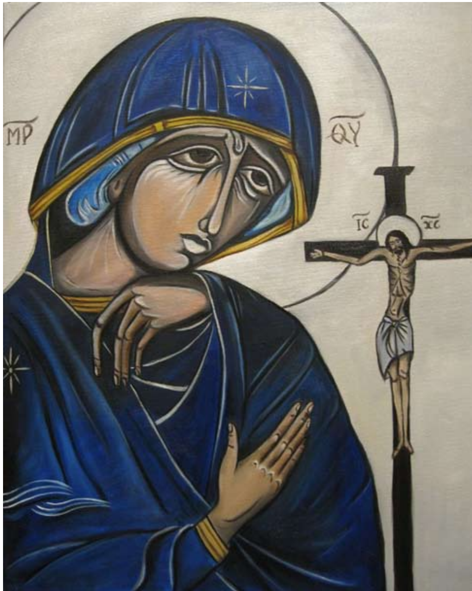
MATKA BOSKA BOLESNA II, olej na płótnie, 50x40 cm, 2014.