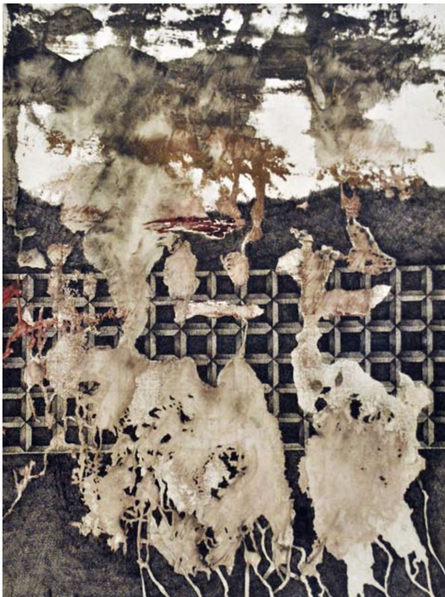
POD POWIERZCHNIĄ-STRUKTURA 4, technika mieszana, 60x80 cm, 2013.