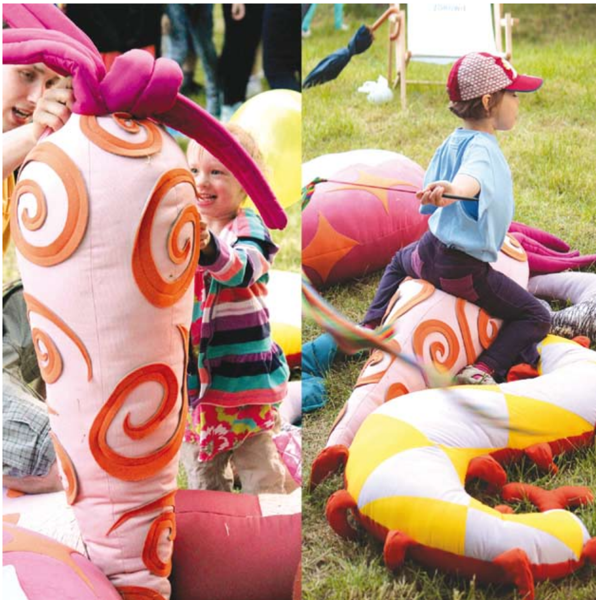
PRZYTULANKI, formy przestrzenne, tkanina, wmiary różne, 2014.