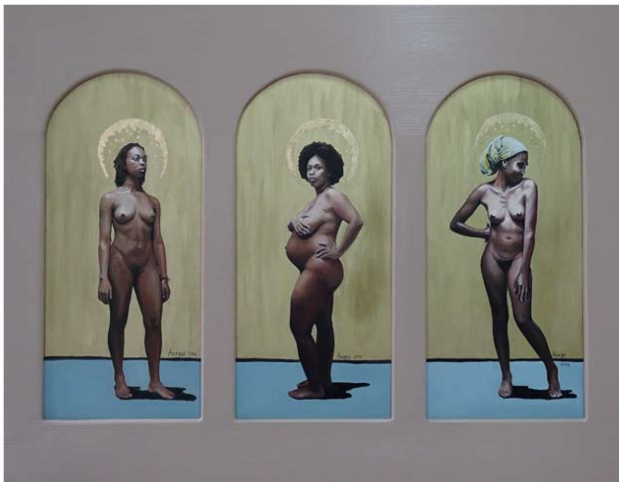
ZWIASTOWANIE, olej i złoty akryl na desce, rama 70x90 cm, 2014.