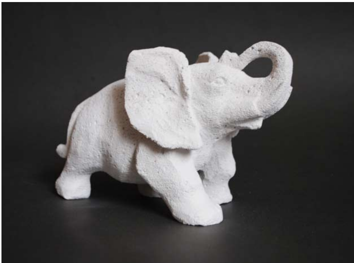
SŁOŃ, suporex, 13x23x11 cm, 2014.