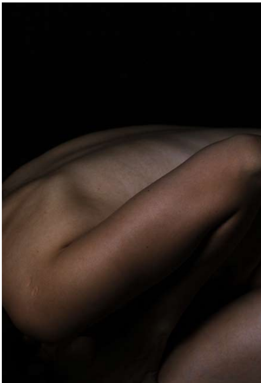
ZWIERZĘCOŚĆ, fotografia, 80x60 cm, 2014.