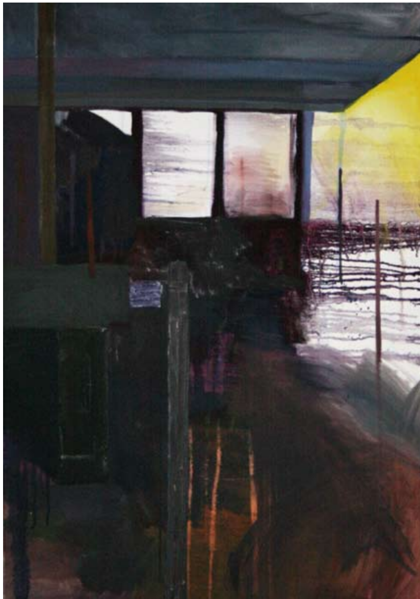
WNETRZE, olej na płótnie, 100x70 cm, 2014.