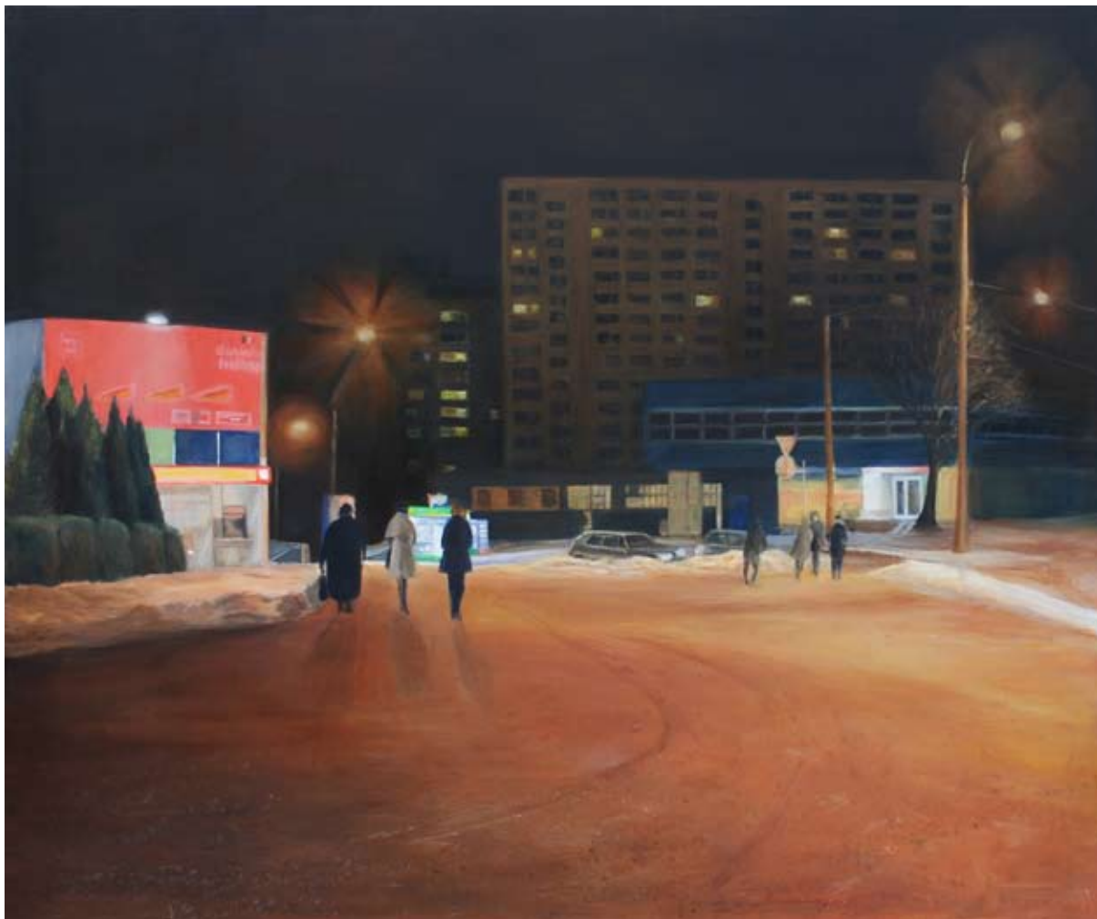
MIEJSKI NOKTURN NR.3, olejna płótnie, 100x120cm, 2014.