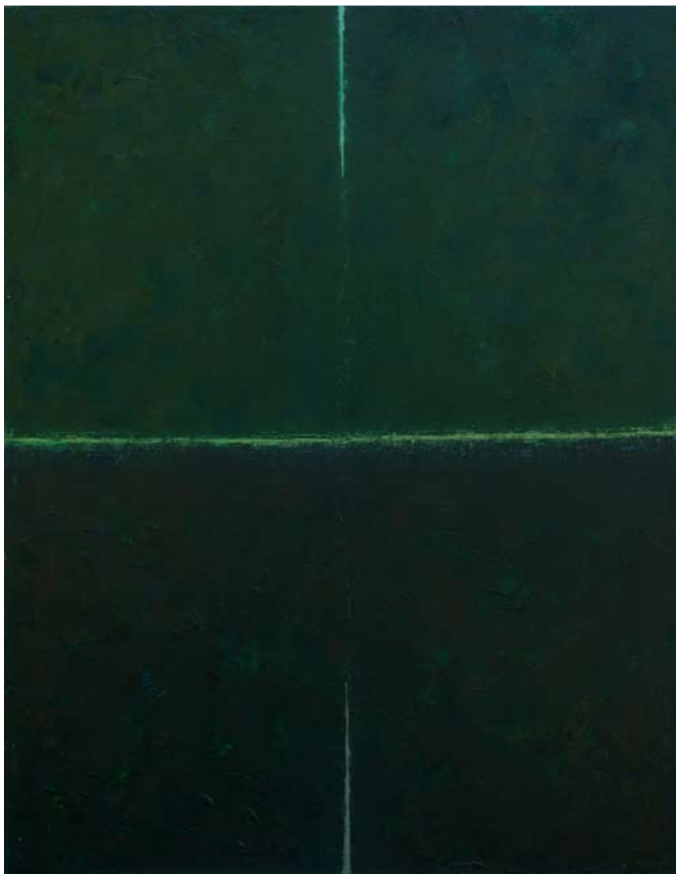
PEJZAŻ Z GÓRECKA, olej na płótnie, 90x70cm, 2013.