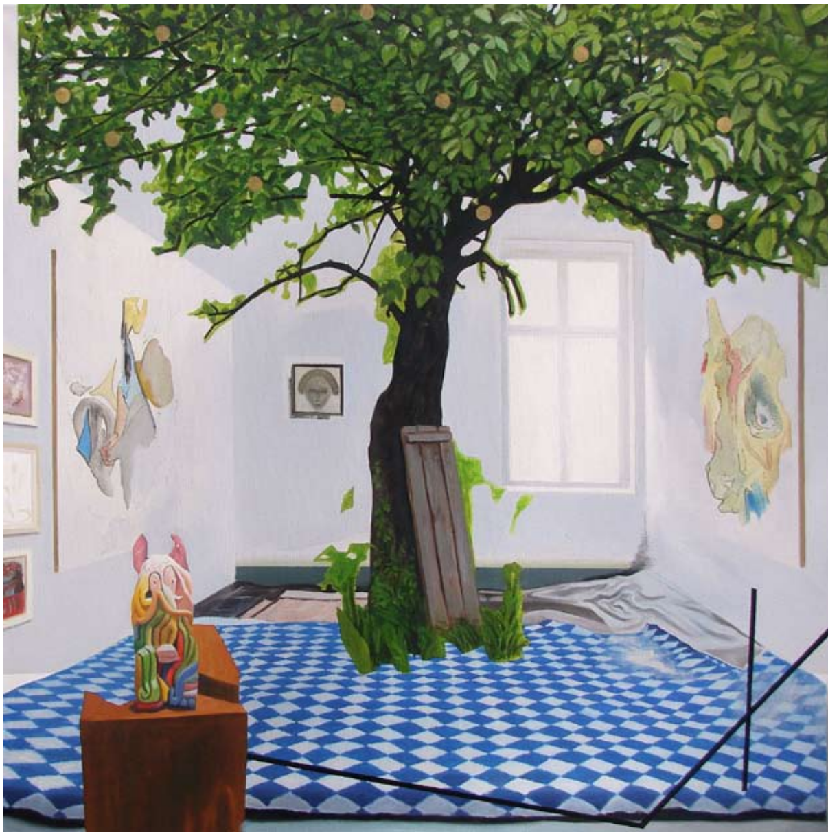
PARADISE LOST vol. 18 (childhood), olej, emalia i złoty akryl na płótnie, 100x100cm, 2014.