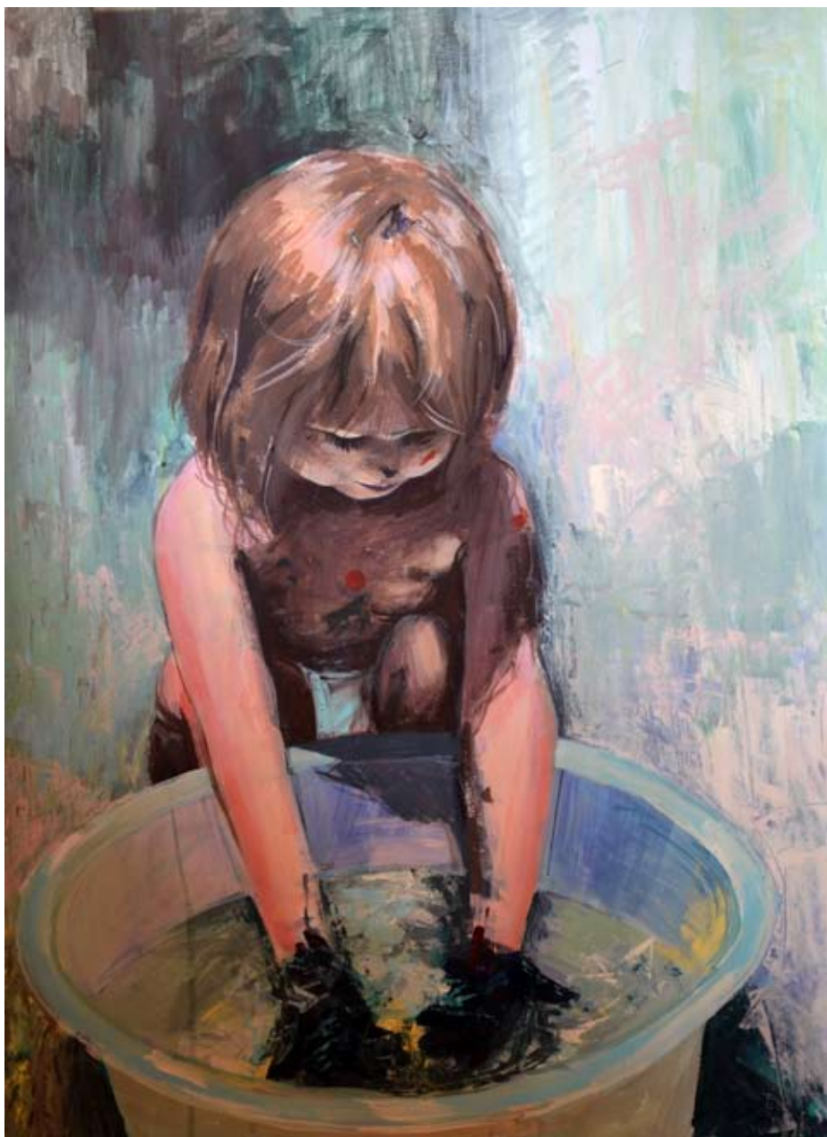
CZYSTOŚĆ TWORZENIA, akryl na płótnie, 70x50 cm, 2014.