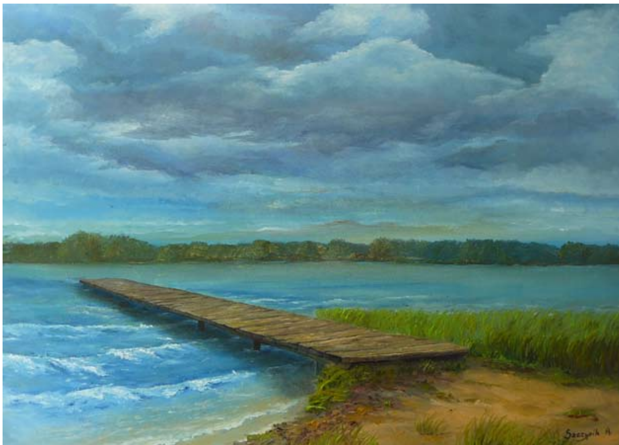
POMOST, olej na płótnie, 50x65cm, 2014.